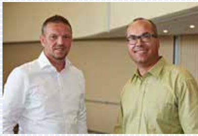
ASIP 2018 FACHTAGUNG Zürich, 30. Mai

Die fachkundigen Referenten vermittelten praxisorientierte Inputs.