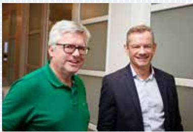
ASIP 2018 WEITERBILDUNG FÜR FÜHRUNGSORGANE VON PK Lausanne, 16. November